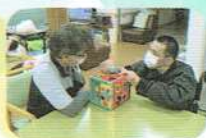
立体パズル 「難しい～」