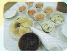
手作りパンケーキで おやつ♪