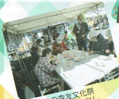
秋の森友文化祭 手厚いおもてなし ありがとうございました！