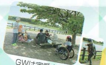
GWは定番大室ダムへ 新緑がきれいでした