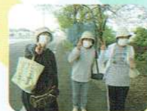
エコバッグを持ってお買い物 朝食用に大好きなパンを購入です