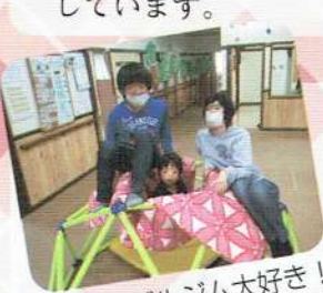
ジャングルジム大好き！