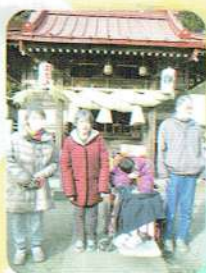
少人数で初詣 おみくじもひいたよ！