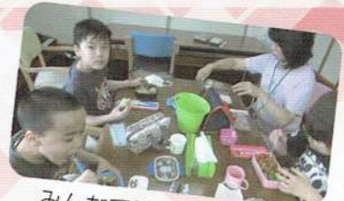
みんなでランチタイム♪