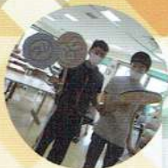
5月「春のおたのしみ会」