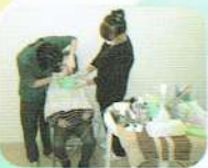
夢ホームで 訪問歯科診療中