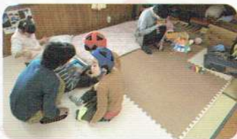
タブレットゲーム「順番ね！」