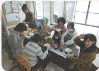
おやつレク「フルーツ盛り合わせ」