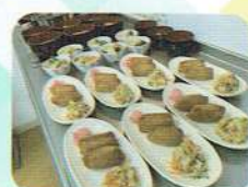
行事食 「いなり寿司&ミニそば」