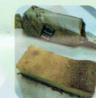
チーズケーキバー