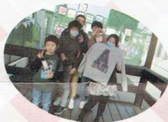
仲良し、並んで「はい、チーズ！」