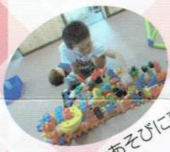
積み木あそびに夢中