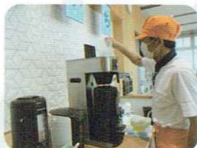
日光市役所カフェ 「お菓子、コーヒーいかがでしょうか！」