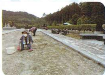
西の杜霊園の清掃