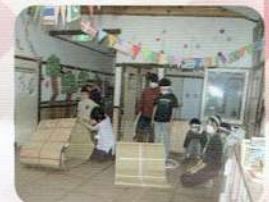
キャタピラーリレー