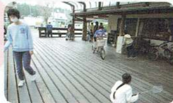
ウッドデッキで昼休み