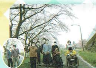
お花見がてらお散歩