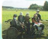
菜の花がきれいな季節♪