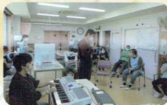
音楽活動♪音楽に合わせてストレッチ！