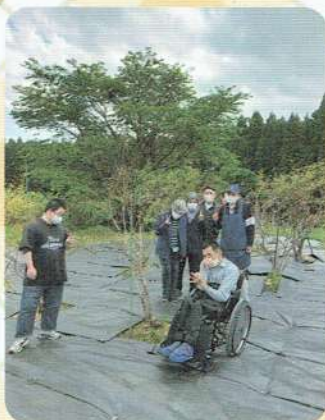
敷地内をお散歩中です