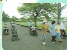
丸山公園でレッツウォーキング！