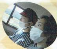
ドライブへGO！「いってきます★」