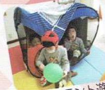
風船持ってテント遊び～