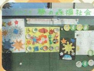
創作活動で作品作り 外の掲示板で展示中！