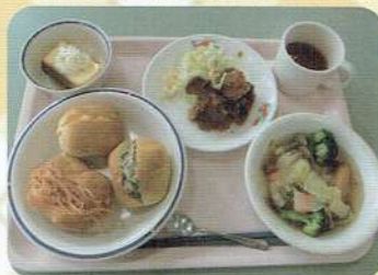
スペシャル給食！ケーキのデザート付き！