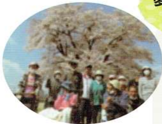
近所に桜を観に行きました！

Q. 自分の部署の良いところを教えてください！ A. 利用者様がのびのびと生活しています。 ・全体的に穏やかな雰囲気、職員のチームワークが良いです！