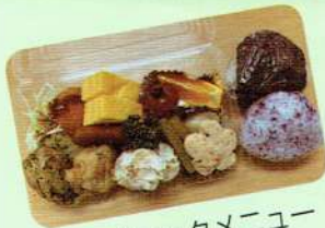
ピクニックメニュー