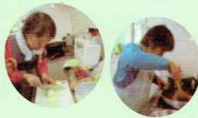
食事作りのお手伝い！

Q. 週末の過ごし方を教えてください！ A. テレビ・スマホで動画視聴・ゲーム・のんびり昼寝 散歩・部屋の片づけ・布団干し