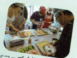
調理実習 手巻き寿司・チョコレートパフェづくり