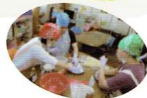
作って、食べて! 楽しい調理!