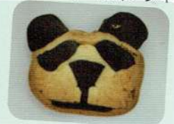
自主生産品一例（クッキー）

A. 作業ごとに職員の担当がついているので、各々責任感をもち支援に取り組んでいます！