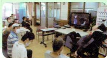
みんなでDVD鑑賞「名探偵コナン！」