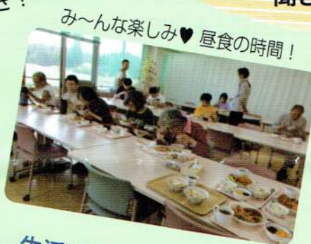
み～んな楽しみ♥昼食の時間！