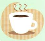
日光市役所 カフェ「tomorrow」