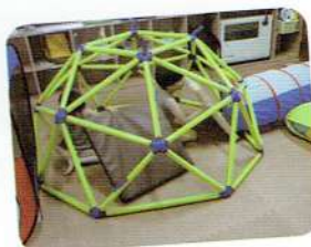
登ったりくぐったり 室内ジャングルジム