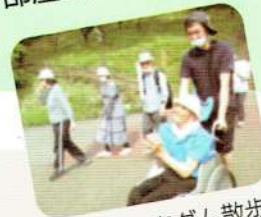
定番の大室ダム散歩！

Q. 週末の過ごし方を教えてください！ A. テレビ・スマホで動画視聴・ゲーム・のんびり昼寝 散歩・部屋の片づけ・布団干し