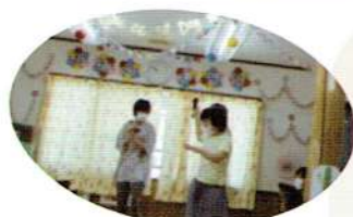
みんな大好き! カラオケ大会